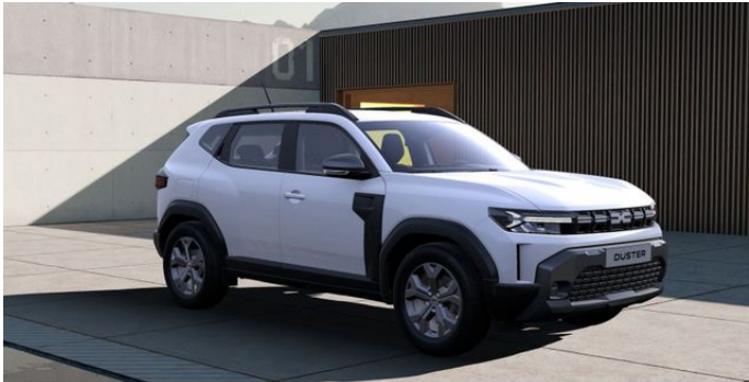
Fahrzeug sofort verfügbar - Originalbilder folgen!