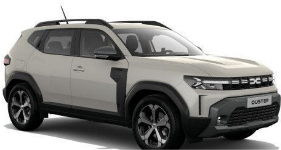
Fahrzeug sofort verfügbar - Originalbilder folgen!