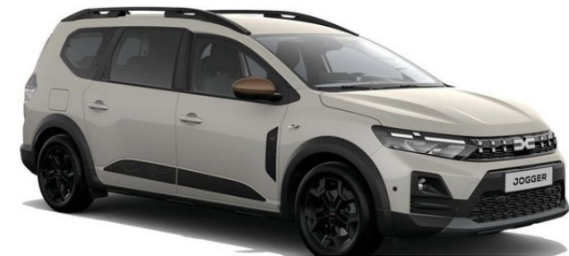
Fahrzeug sofort verfügbar - Originalbilder folgen!