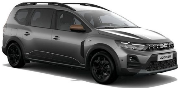
Fahrzeug sofort verfügbar - Originalbilder folgen!